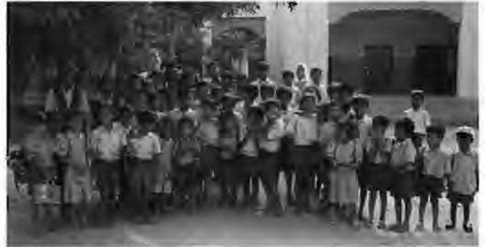
I bambini dell'asilo Olavina Halli

Il 17 giugno ci sarà la giornata "dedicata a Suor Amelia" presso la Polse di Cougnes di Zuglio con il seguente programma: